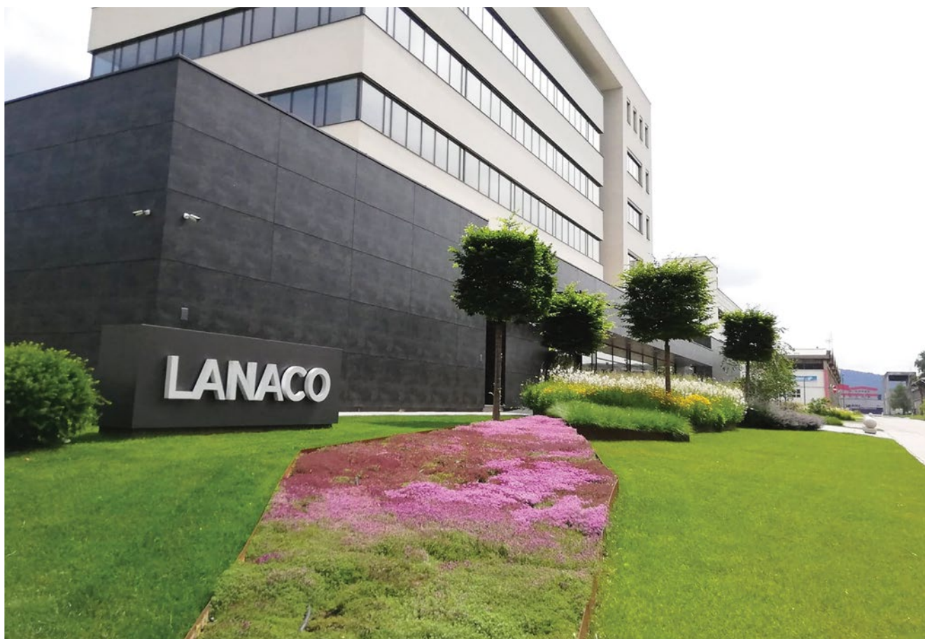
Sinagoga d.o.o. Sombor / autor: Renato Lakatoš, Groovel

Modernom čoveku je više nego ikada potrebno da aktivira možda zaboravljene niti koje ga spajaju sa prirodnim okruženjem. Kroz tehnologije i savremene tokove, ove niti mogu biti još jače, više ispletene i uočljivije, ukoliko prirodu shvatimo, razumemo i pratimo