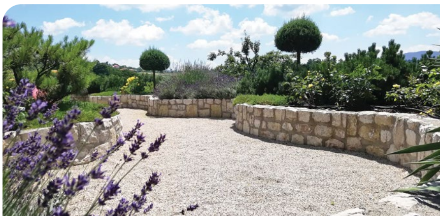
Krovni vrt Tešanj / autor projekta: Nada Bukejlović