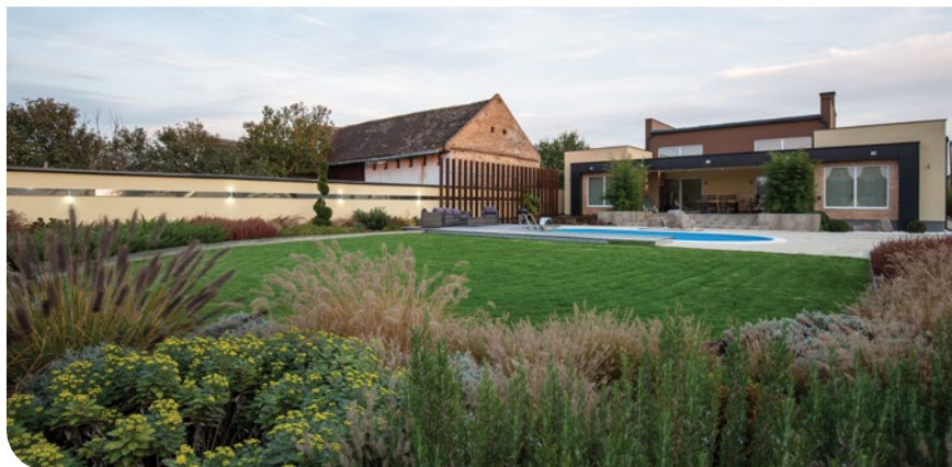
Bašta 128, Prigrevica / autor: Renato Lakatoš, Gorovel

“ Trend naturalističkog i biofilnog dizajna predstavlja stvaranje pejzaža koji izgleda kao da pripada prirodi uz uključivanje elemenata prirode u izgrađeno okruženje