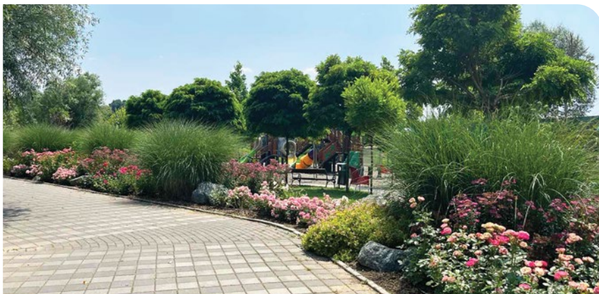
Zoo vrt, Tuzla / autor: Nada Bukejlović

Usled pandemije, koja je sve zatekla u kućama i stanovima, potražnja za životnim prostorima na otvorenom je porasla. Moderan čovek danas sve više traži izlaz u prirodi, svom vrtu i okućnici, parku, šetalištu uz reku, zelenom krovu ili terasi. Sve više se gradi izvan gradova, a u samim centralnim gradskim jezgri se posebno ceni kvadrat dvorišta ili terase. Sve više je domova sa otvorenim kuhinjama, pergolama, ognjištima i prostorima za sedenje dizajniranim za druženje, zabavu i opuštanje.