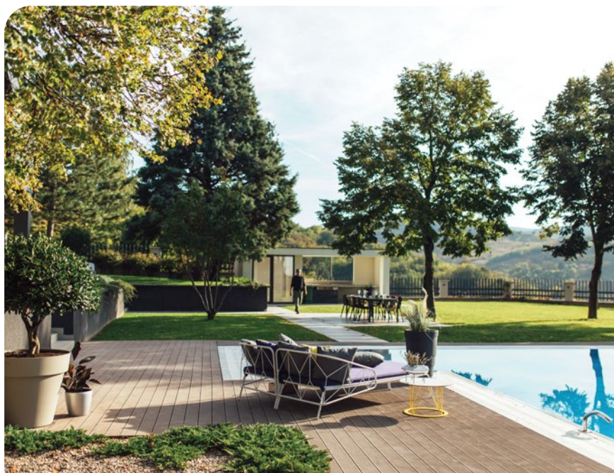
Privatna kuća, Fruška gora / autor: Landscape Factory / foto: Dejan Popov

Vrtovi i terase su dokaz da su arhitektura i pejzažna arhitektura neraskidivo povezane, kao i da je vrtna umetnost sačinjena iz mnoštva elemenata koji ne podrazumevaju samo vegetaciju već i sve ostalo što se nalazi upravo tu, u eksterijeru. Pejzažna arhitektura obuhvata sve ono što se uočava u spoljašnjem prostoru – od krupnih strukturalnih elemenata, funkcionalnih pozicija i sadržaja, do finalnih detalja.