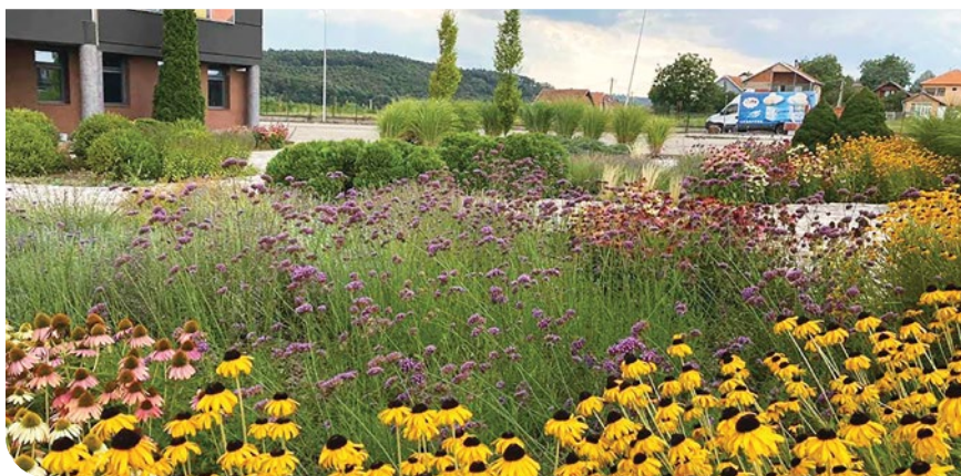
Poslovni prostor Klas Mrvić, Kragujevac / Autor: Zelegrad

Minimalistički pejzaži i minimal eksterijer dizajn sve više su prisutni kako dizajneri propagiraju estetiku prefinjenosti, odsustvo nepotrebnih elemenata i akcentovanje suštine kroz perfektne pojedinačne detalje. Sada počinje da na velika vrata ulazi i u kreacije pejzažnog dizajna