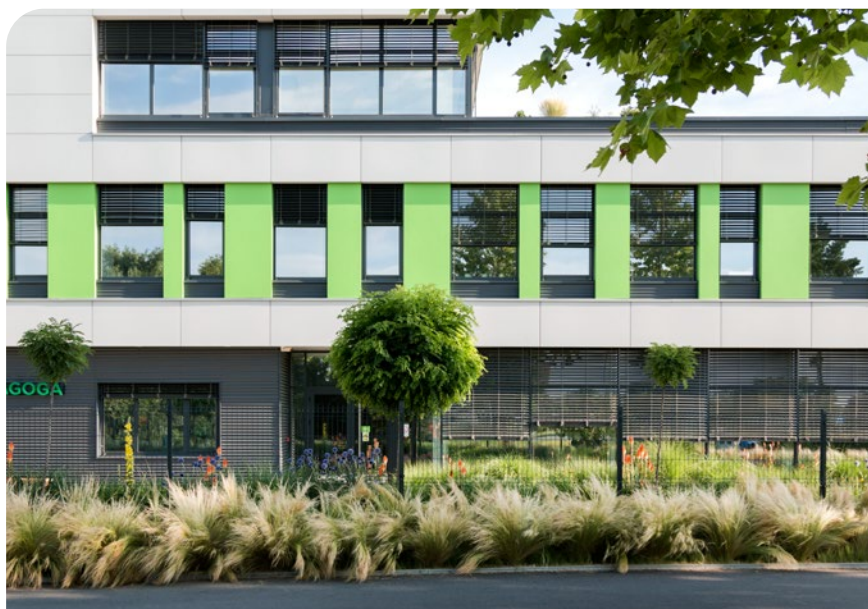
Sinagoga d.o.o. Sombor / Autor: Renato Lakatoš Gorovel

Savremeni način gradnje doveo je do pojave velikog broja kvalitetnih materijala koji svojim karakteristikama omogućavaju visoku energetska efikasnost objekata