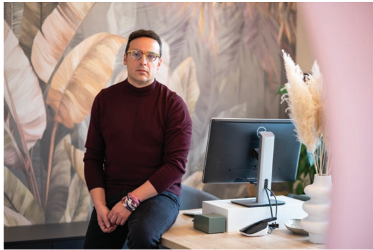
AUTOR: LANDSCAPE FACTORY STUDIO DEJAN POPOV – PEJZAŽNI ARHITEKTA I DIZAJNER OBJEKAT: EKSTERIJER VILE LOKACIJA: BEOGRAD, SRBIJA POVRŠINA OBJEKTA: 820 m 2